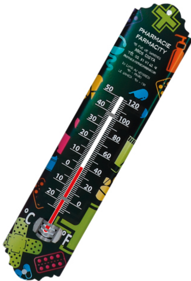
Thermomètre métal personnalisable – Colorfeel