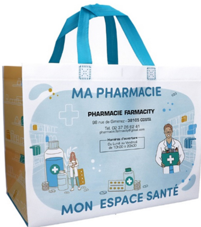
Sac de pharmacie réutilisable personnalisable Proximity