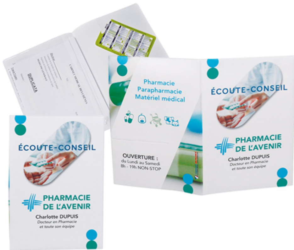
Porte ordonnance et carte vitale personnalisable – Promedica