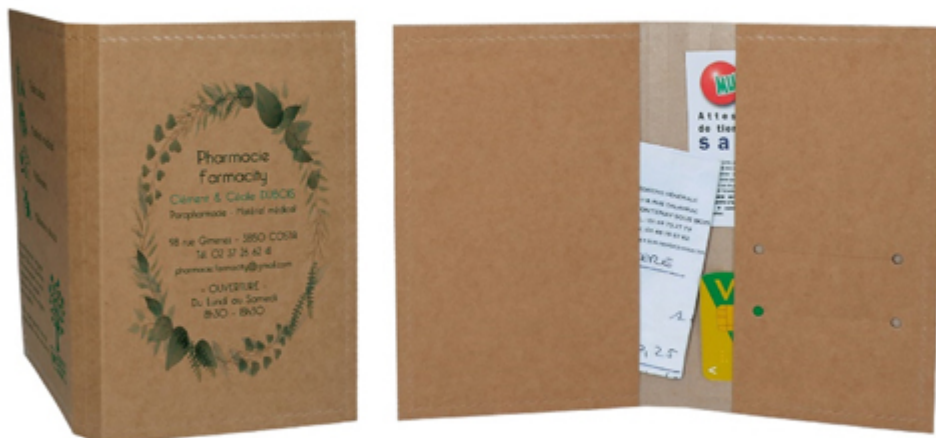
Porte ordonnance et carte vitale en carton Authentica