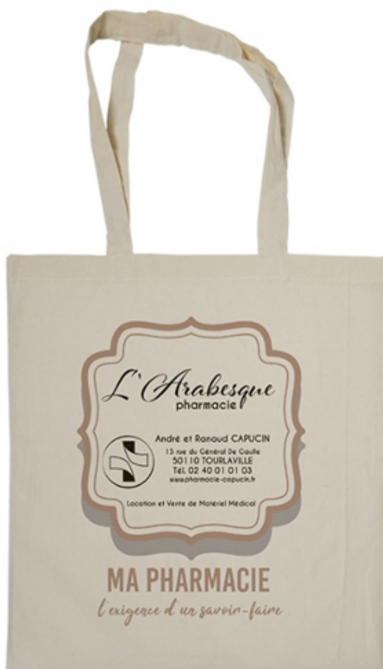
Sac de pharmacie 100% coton personnalisable Authentica

l'espace rassurant et accueillant : place aux matières naturelles et à l'harmonie des couleurs (caramel, taupe, marine, anis) ; un parquet en bois clair pour le revêtement au sol, associé au vert clair au plafond pour rappeler l'eau et les éléments de la terre. Pour la touche vintage, invitez quelques pots d'apothicaires (à chiner sur Selency ou eBay).