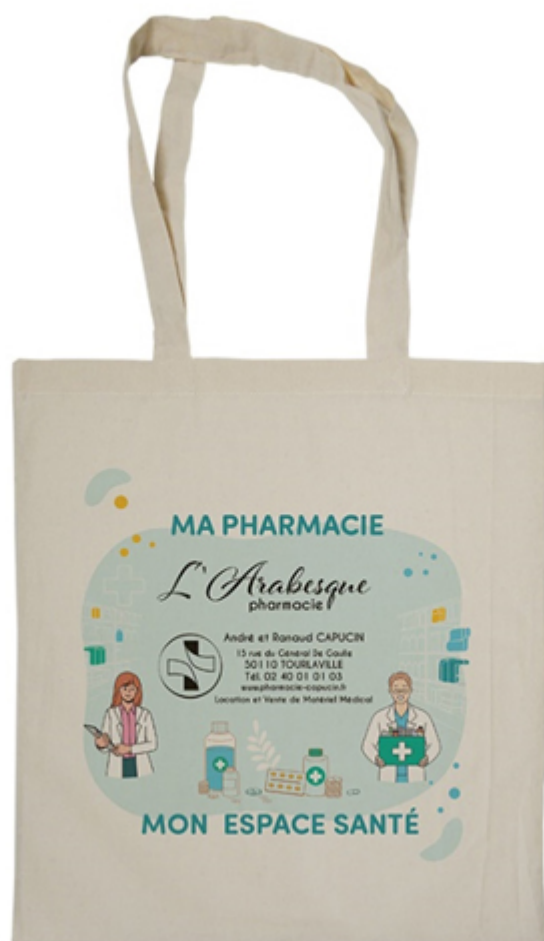
Sac 100% coton personnalisable – Proximity