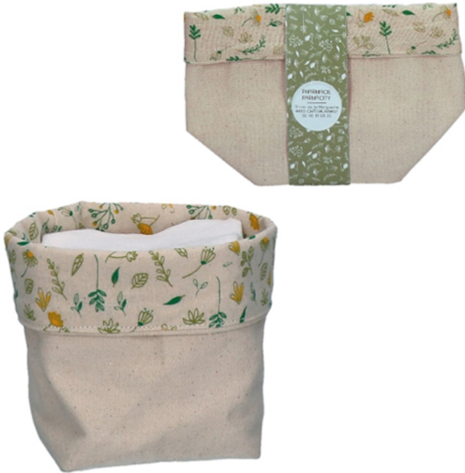
Trousse à coton bébé motif Natura