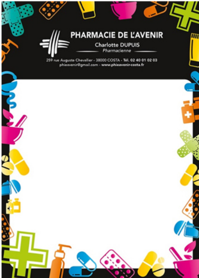
Bloc note personnalisable Colorfeel