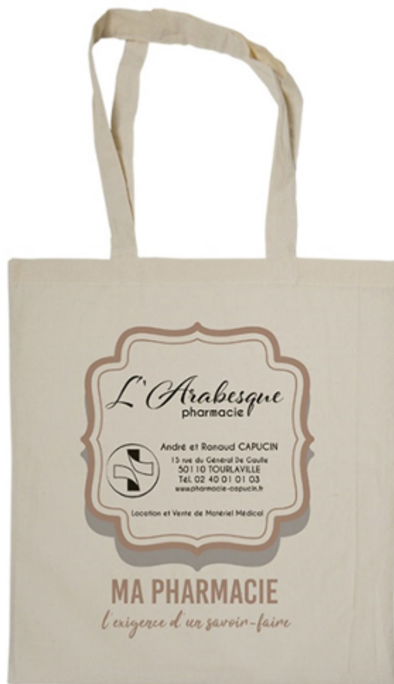
Sac en coton personnalisable – Authentica