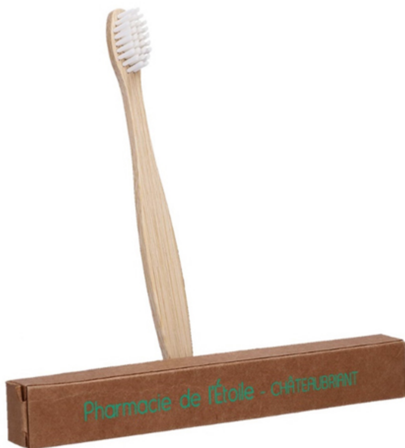
Brosse à dent en bois Natura