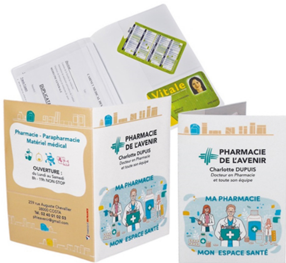
Porte ordonnance et carte vitale personnalisable – Proximity