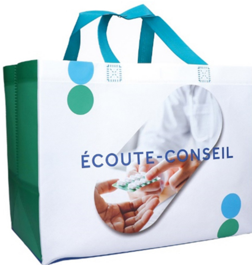
Sac de pharmacie réutilisable personnalisable Promedica