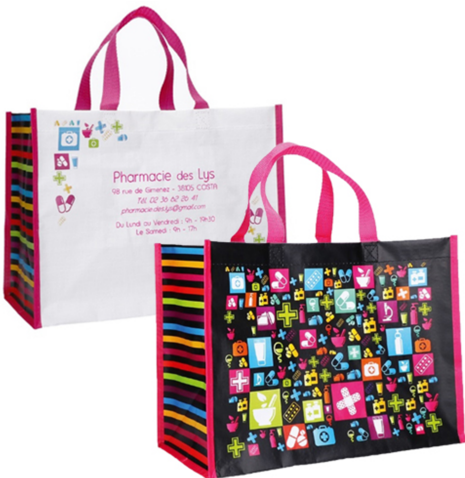
Sac cabas réutilisable personnalisable – Colorfeel