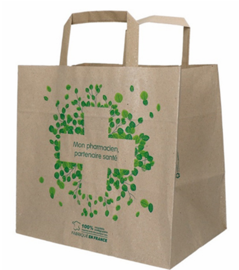
Sac papier à base d'herbe