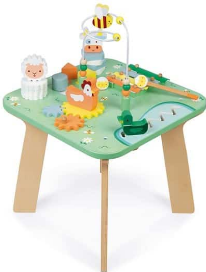
Table en bois multi-activités « Jolie prairie ». Nature&Découvertes.

Le « tout en bois » fonctionne très bien et représente un investissement limité : Nature&Découvertes propose un mobilier coloré associé à des jeux de manipulation bien conçus.