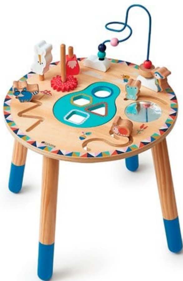
Table en bois multi-activités « Galopins ». Nature&Découvertes.

Différenciez-vous de vos concurrents et valorisez votre officine en lui offrant une image moderne grâce au numérique. À découvrir, Connect Innov , créateur de Table's Kid, propose un PC intégré à une table interactive équipée de 30 jeux d'éveils, ludiques et pédagogiques adaptés aux différentes tranches d'âges, à partir de 3 ans. Kidéa propose aussi un totem interactif adaptée aux petits espaces. Elles fonctionnent sans connexion internet.