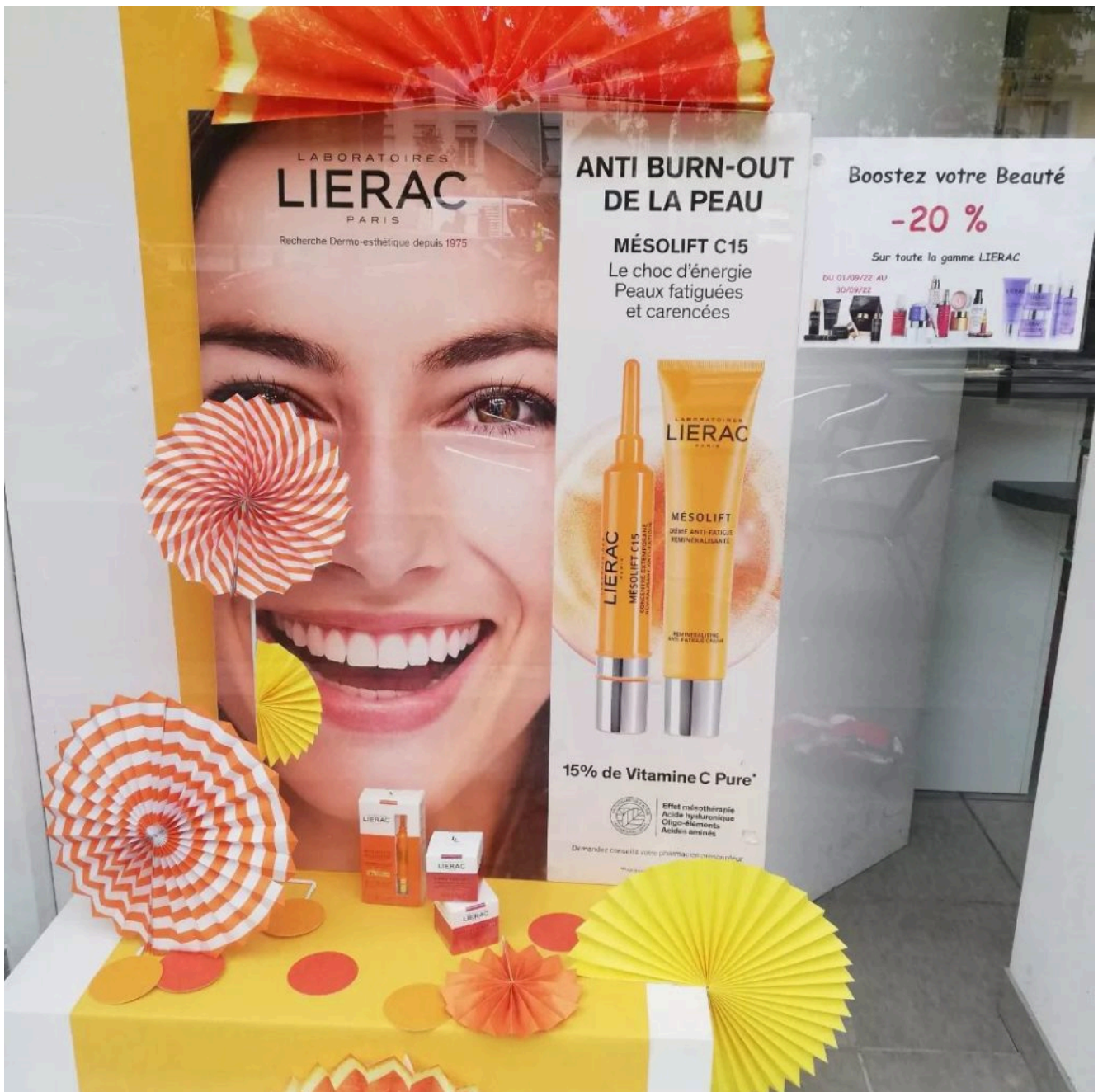
Vitrine fruitée à la pharmacie de Saint-Étienne par Créa Vision.