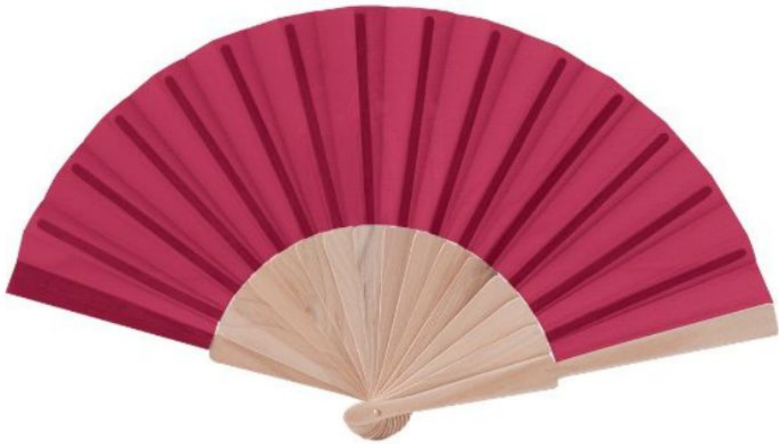
éventail en bois naturel coloris rose