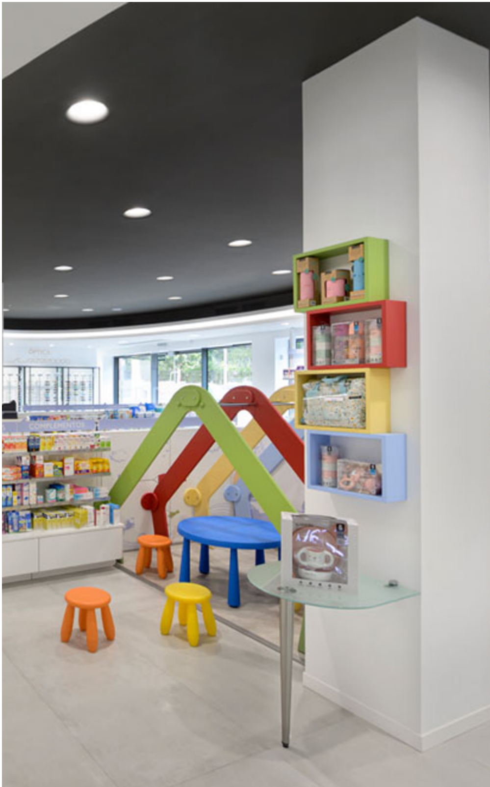
Un coin enfant ludique à la pharmacie la Cala. (4)

Animation dessins de Noël à la pharmacie de l'Avre