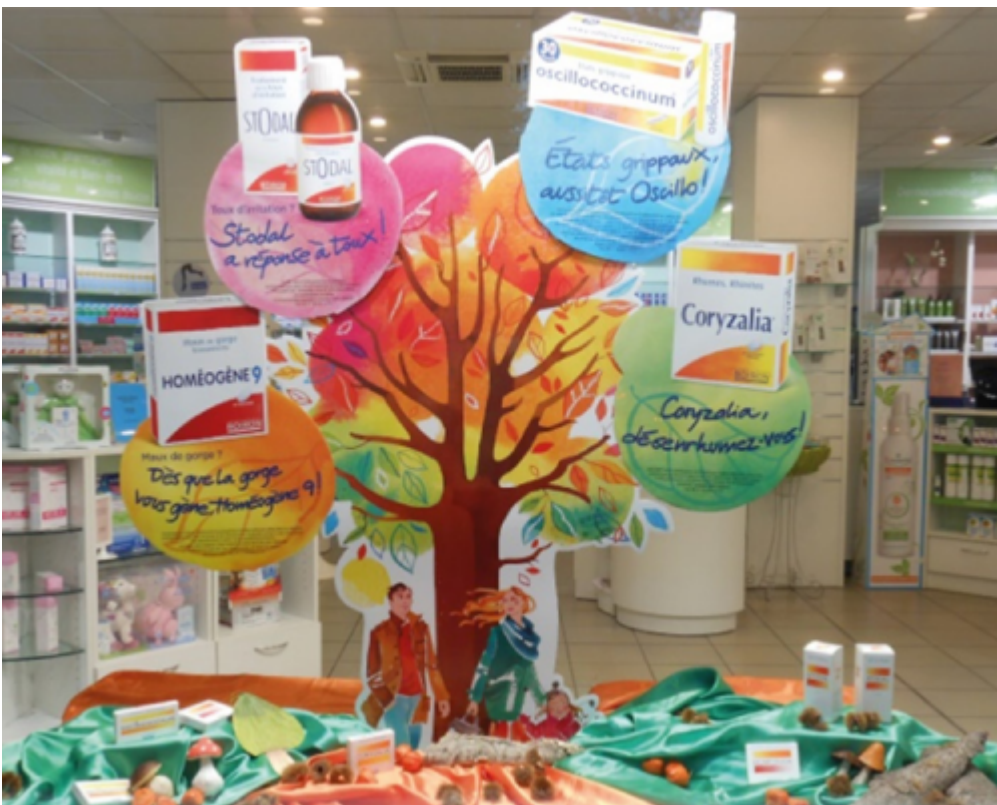
Des vitrines animées pour relayer vos thématiques saisonnières (3)