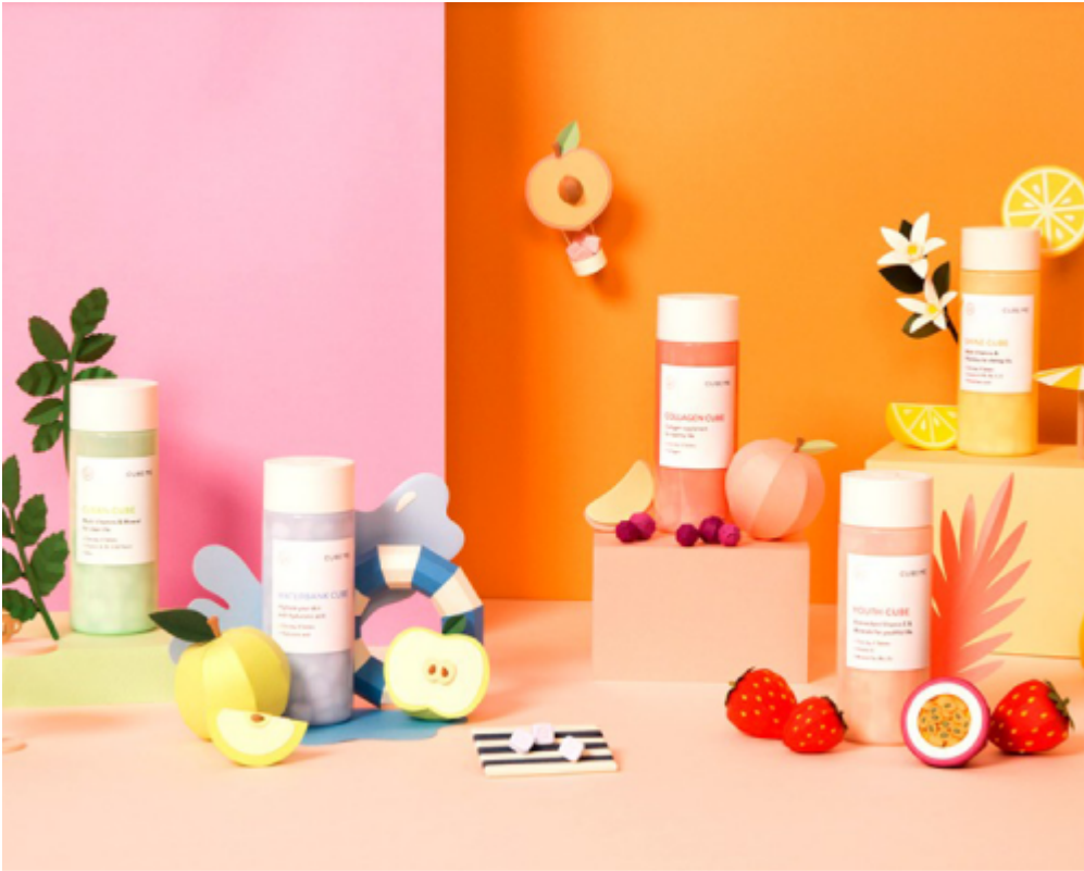
Vitrines acidulées et protection solaire pour l'été (2)